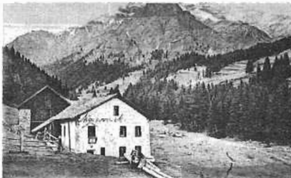
in zijn leven zal meemaken. 'Hier woon ik' schrijft Mengelberg op een kaart

Het is op 19 juli 1910 volop zomer als hij op een van zijn wandelingen de boerderij 'Hof Zuort' ontdekt en daar zijn intrek neemt. Bij het ontwaken maakt hij mee zoals Haydn zich het aanbreeken van de dag muzikaal voorstelt. Bij realistisch hanengekraai door de hobo zingt de jonge boer Simon: "Der Tages Herold meldet sich mit scharfem Laute rufet er zu neuer Tätigkeit den ausge-ruchten Landmann auf". Geniaal laat Haydn de zon chromatisch opkomen vanuit het pianissimo tot een groot fortissimo van solisten, koor en orkest eindigend in de lofzang: "Heil! O Sonne Heil! Des Lichts und Lebensquelle Heil!" Dit grootse moment van ontwaken van de dag maakt Mengelberg, gedurende de zes zomerse weken die hij in Hof Zuort verblijft dagelijks mee; zoals hij ook de andere jaargetijden in de natuur